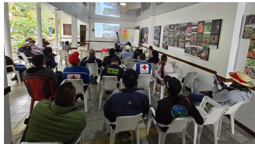
Imagen 2: Primer Acercamiento para la Gestión del Riesgo de Desastres en el Territorio Nasa